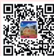
台职院官方微博二维码